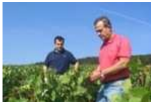
Domaine Bitouzet- Prieur