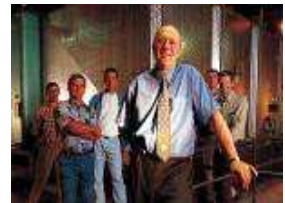
Cave des Vignerons de Mancey