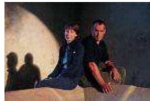
Domaine Chofflet - Valdenaire